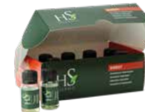
8x8 ml 25006552

Shampoo Energizzante Energising Shampoo Versterkende shampoo Shampooing Énergisant