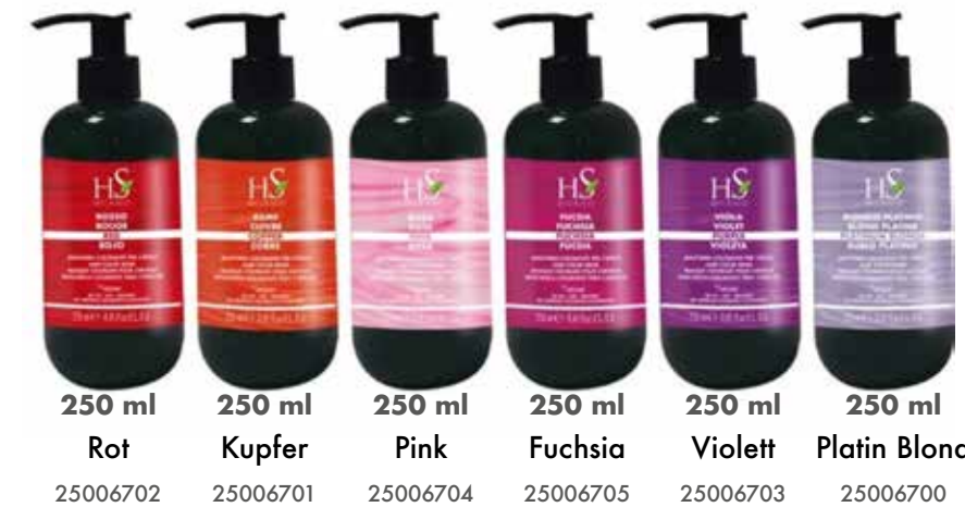
250 ml 250 ml 250 ml 250 ml 250 ml 250 ml Rot Kupfer Pink Fuchsia Violett Platin Blond 25006702 25006701 25006704 25006705 25006703 25006700

Pigments extra Intenses, Kératine Végétalienne, Sans Silicone