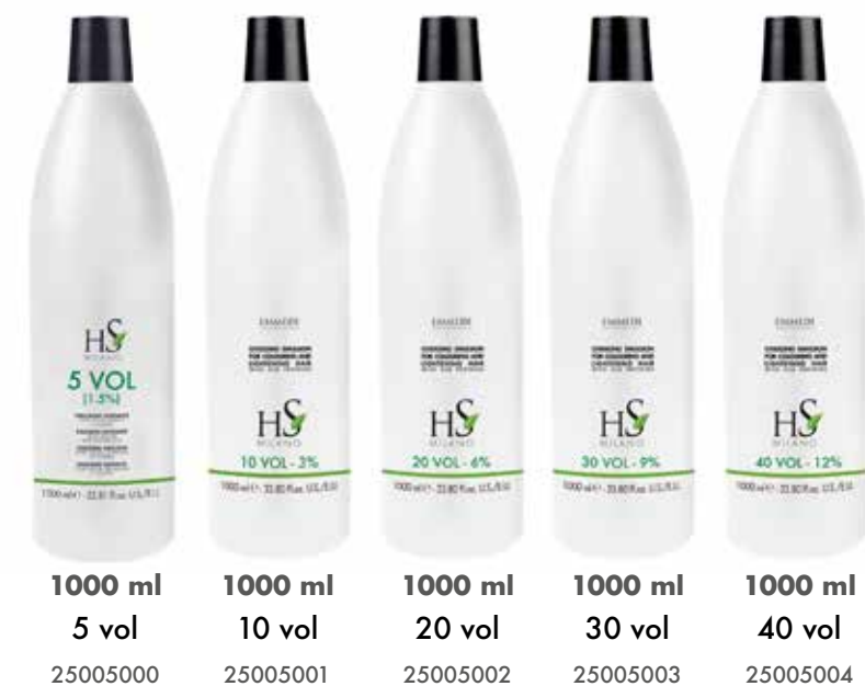
1000 ml 1000 ml 1000 ml 1000 ml 1000 ml 5 vol 10 vol 20 vol 30 vol 40 vol 25005000 25005001 25005002 25005003 25005004

Attivatori Activators Activator Activateurs