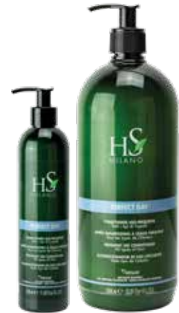
350 ml 25006582 1000 ml 25006583

Shampoo Uso Frequente Frequent Use Shampoo Iedere dag shampoo Shampooing à Usage Fréquent