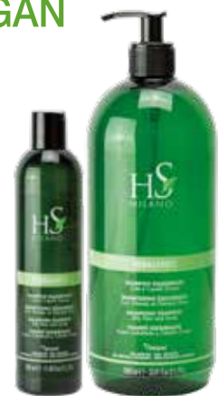
350 ml 25006570 1000 ml 25006571