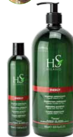
350 ml 25006550 1000 ml 25006551