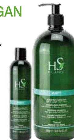
350 ml 25006560 1000 ml 25006561