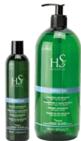
350 ml 25006580 1000 ml 25006581